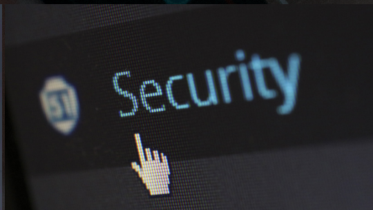
강력한 콘텐츠 보안