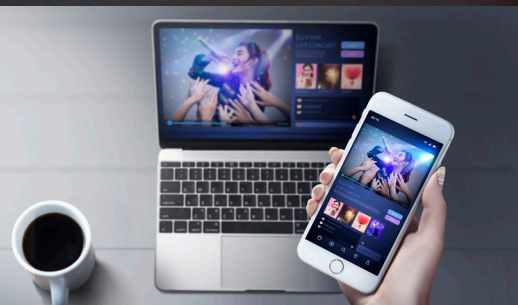
Web & App 플레이어