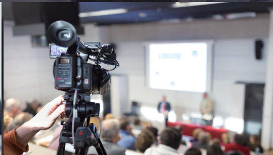
기업 / 사내 타운홀 미팅